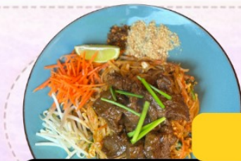
Pad Thai Boeuf