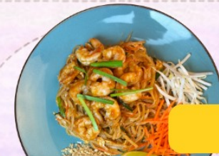
Pad Thai crevettes