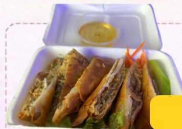
Nems Thai Veggie