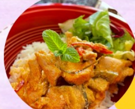
Panang Poulet coco