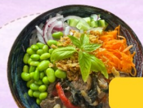
Poke Bowl Kapao