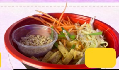
Pad Thai Veggie