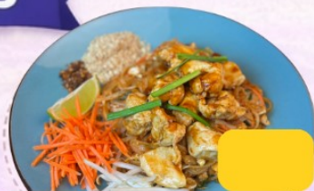
Pad Thai Poulet